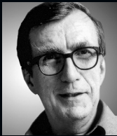
Bruno Latour (F)