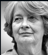
Isabelle Stengers (B)