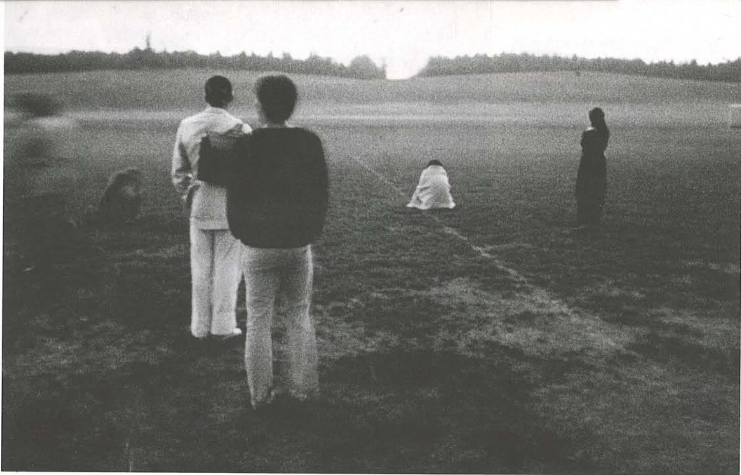
Black Market, «Götzendämmerung» Performance, Bern 1986.